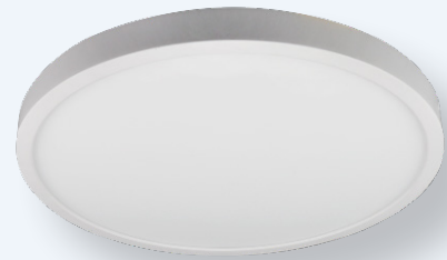
Modèles de 12,7 cm (5 po), 17,78 cm (7 po), 22,86 cm (9 po), 30,48 cm (12 po) et 38,1 cm (15 po) offerts