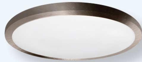
Modèles de 30,48 cm (12 po), 38,1 cm (15 po) et 48,26 cm (19 po) offerts